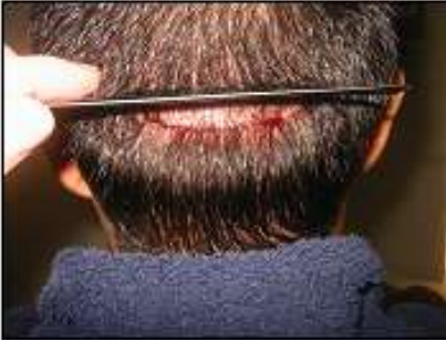
Donorlitteken onmiddellijk na hechting