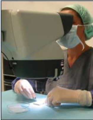
De microchirurgische voorbereiding van de transplantaten