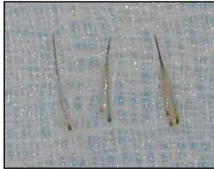
Folliculaire eenheden met 1, 2 en 3 haartjes