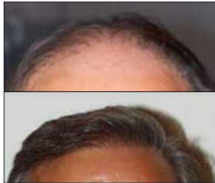
Een passende haarlijn voor een zestiger

Tijdens het consultatiegesprek zal het ontwerp van de nieuwe haarlijn besproken worden. Er wordt dan voor u een passende haarlijn uitgewerkt en het concept zal toegelicht worden.