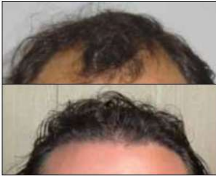
Een passende haarlijn voor een dertiger