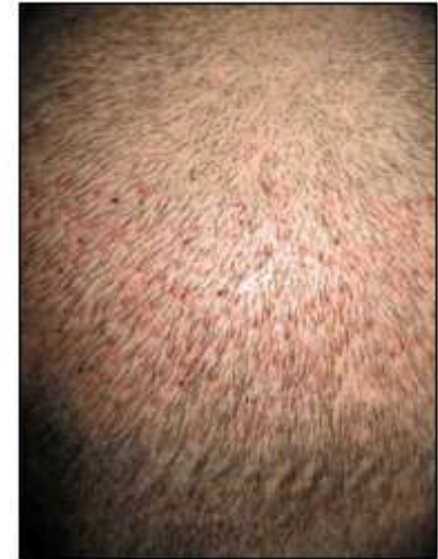
Patiënt 1 dag na FUE – close-up