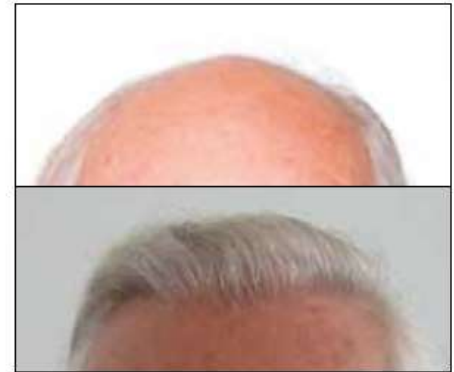
Een passende haarlijn voor een zeventiger