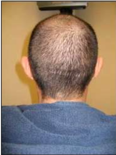
Patiënt voor FUE

De «Follicular Unit Extraction» is zonder twijfel de belangrijkste en meest revolutionaire ontwikkeling van de afgelopen 10 jaar in de moderne haarchirurgie. Deze techniek omvat de verwijdering van folliculaire eenheden zonder daarbij een litteken achter te laten. De folliculaire eenheden worden bij deze techniek d.m.v. een hol micronaaldje (doorsnede van 0,5 à 1mm) selectief verwijderd aan de achterzijde van het hoofd, zodat elk groepje haarfollikels exact zo verwijderd wordt, dat het haar voor haar in dezelfde groep en dezelfde positie blijft en er zeker geen omliggend huidweefsel wordt beschadigd. De Follicular Unit Extraction is een zeer arbeidsintensieve procedure, waarbij slechts een beperkt aantal transplantaten kan worden verwijderd per behandeling. Desondanks zijn we in staat om per behandeling een gemiddelde van 600 tot 1300 haarfollikels te transplanteren. Dit betekent dat in sommige gevallen verschillende behandelingen nodig zijn om het gewenste resultaat te behalen.