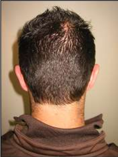
Donorlitteken 1 jaar na behandeling

Om de juiste hoeveelheid haarfollikels te verkrijgen voor een optimaal resultaat in het ontvangstgebied wordt de afmeting van het te verwijderen huidreepje vóór de behandeling ingeschat door de haarchirurg. De natuurlijke dichtheid van het donorgebied bepaalt wat de optimale lengte en breedte van de incisie is. Het huidreepje met haarfollikels wordt verwijderd d.m.v. de "enkelvoudige strip techniek".