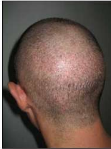
Patiënt 1 dag na FUE