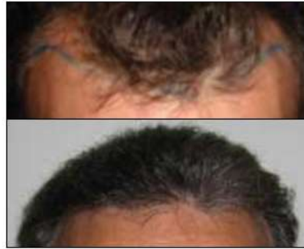
Een passende haarlijn voor een veertiger