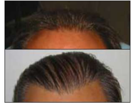
Een passende haarlijn voor een vijftiger

Tijdens het consultatiegesprek zal het ontwerp van de nieuwe haarlijn besproken worden. Er wordt dan voor u een passende haarlijn uitgewerkt en het concept zal toegelicht worden.