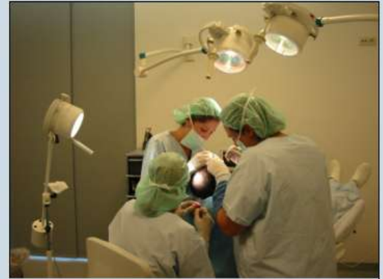
Het inzetten van de transplantaten door gespecialiseerde verpleegkundigen